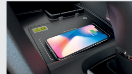
Carregador por Indução. (versão Touring)