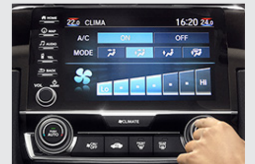
Ar-Condicionado Digital com Função Dual Zone. (versões EXL e Touring)

Vem equipado com ar-condicionado digital e ajuste automático de temperatura para todas as versões. A partir da versão EX , há saída de ar para os bancos traseiros e as versões EXL e Touring contam também com função Dual Zone . O Freio de Estacionamento Eletrônico EPB (Electronic Parking Brake) agrega mais comodidade a bordo, ao ser acionado com um simples toque. Já a função Brake Hold mantém o carro parado, em qualquer terreno ou inclinação, até que o pedal do acelerador volte a ser pressionado.