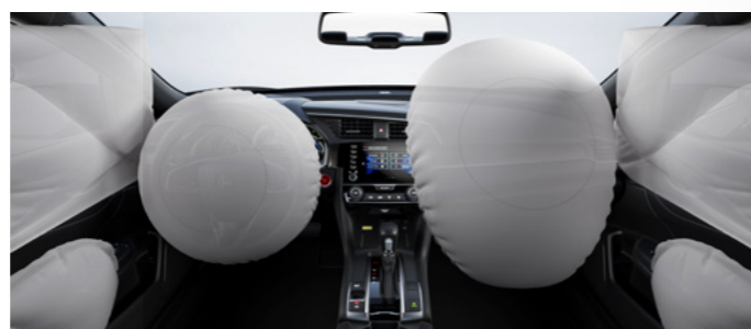
6 Airbags (2 frontais, 2 laterais e 2 de cortina).

Projetado para o seu conforto, o Honda Civic possui câmbio de transmissão automática do tipo CVT (Continuamente Variável) e, a partir da versão Sport , Paddle Shift de 7 velocidades que combinados proporcionam uma condução suave, com respostas mais precisas e aceleração linear.