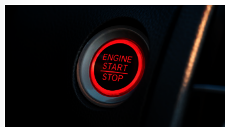
Botão de Partida do Motor (Start/Stop). (a partir da versão Sport)

E tem mais: agora para dar a partida nas versões Sport e EX , basta pisar no freio, pressionar o botão de partida do motor (START/STOP) e seguir viagem, sem a necessidade do uso de chaves para ignição. Para sua segurança, todas as versões do Honda Civic 2021 contam com o sistema VSA (Vehicle Stability Assist) , que controla a tração das rodas e corrige movimentos em situações que exigem mais estabilidade, além do sistema HSA (Hill Start Assist) , que auxilia a saída em ladeiras, garantindo mais segurança e conforto. O Honda Civic conta com 6 airbags , sendo 2 airbags frontais , 2 laterais e mais 2 airbags de cortina em todas as suas versões. Para a versão Touring , o exclusivo Sistema Honda LaneWatch™ é um assistente de visibilidade lateral para redução de pontos cegos.