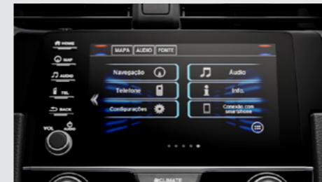
Multimídia de 7" com Navegador; Interface para Smartphone. (versões EXL e Touring)

que mantém a velocidade e os ajustes de áudio e telefone . O modelo também conta com conectividade para smartphones Apple CarPlay e Android Auto™ . Nas versões EXL e Touring , a Central Multimídia ainda agrega navegador GPS . E, para seu total conforto, a versão Touring ainda possui carregador por indução (wireless) no console central. Basta apoiar o seu smartphone 2 e, sem a necessidade de nenhum fio, o aparelho passa a ser carregado.