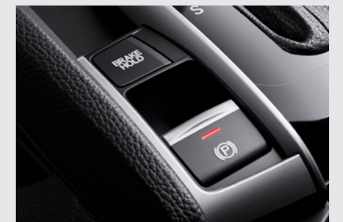
Freio de Estacionamento Eletrônico (EPB) com Função Brake Hold.

As versões EXL e Touring agregam sensor de chuva para acionamento automático dos limpadores de para-brisa. A versão Touring adiciona partida do motor à distância , para-brisa com isolamento acústico e o banco do motorista com ajuste lombar e regulagens elétricas para maior conforto.