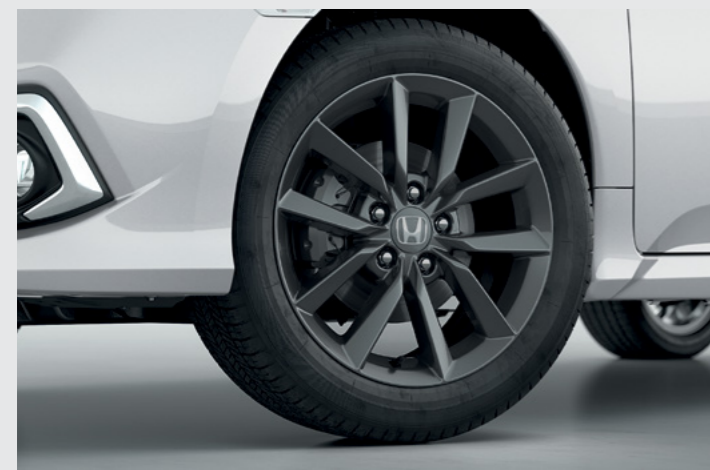
Rodas de Liga Leve 17".

A versão Sport possui itens exclusivos como a grade frontal e rodas diamantadas com acabamento Dark e aerofólio traseiro . Além disso, as versões EX, EXL e Touring possuem a nova opção de cor interna cinza . Reforçando o refinamento do acabamento interior, todas as versões possuem painel de instrumentos macio ao toque, porta luvas e espelhos de vaidade iluminados. A versão Touring , que entrega o máximo da experiência Civic, possui teto solar com acionamento através de toque .