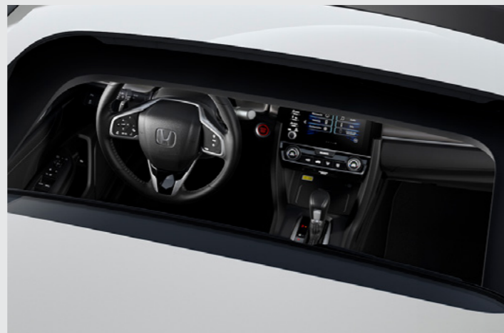
Teto Solar. (Versão Touring)