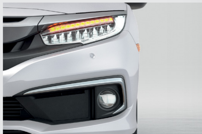
Faróis Full LED. (versões EXL e Touring)