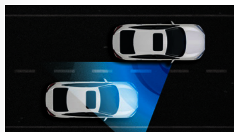
Exclusivo Sistema Honda LaneWatch™. (versão Touring)