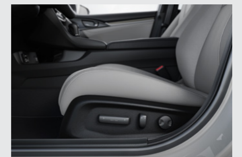
Banco do motorista com ajuste lombar e regulagens elétricas. (versão Touring)